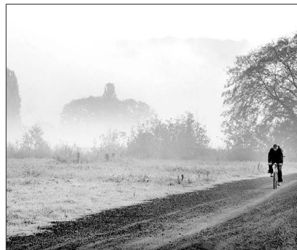
Alle reden vom Wetter. Immer. Immer wieder. Denn jeder Tag hält wieder neue, oft überraschende Spielarten für Mensch und Natur bereit. Zu jeder Jahreszeit. Bei Tag und bei Nacht.